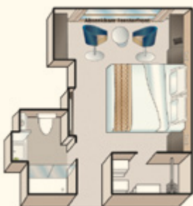
2-Bett-Kabine, Mozart- und Strauss-Deck

Inbetriebnahme: Mai 2023 Flagge: Deutschland Länge: 135 m, Breite: 11,4 m Höhe über Wasser: 6 m Geschwindigkeit: 25 km/h Decks: 4, Kabinen: 67, Suiten: 12 Besatzung: ca. 46