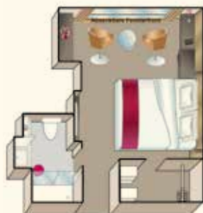
A1 Kabinen (Mozart-Deck) B1/B4 Kabinen (Strauss-Deck)

Inbetriebnahme: Mai 2015 Flagge: Deutschland Länge: 135 m, Breite: 11,4 m Tiefgang: 1,45 m Höhe über Wasser: 6 m Geschwindigkeit: 25 km/h Decks: 4 Kabinen: 72, Suiten: 12 Passagiere: 168 Besatzung: ca. 46