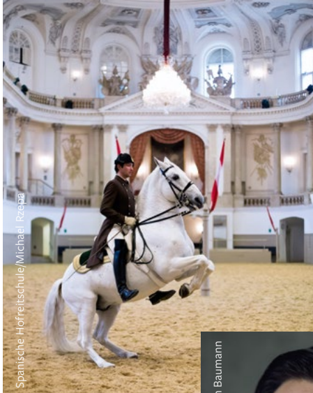
Spanische Hofreitschule, Melk