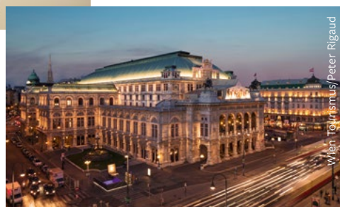
Wachau, Passau, Regensburg, Nürnberg