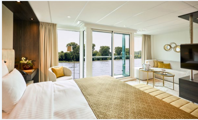
Großzügige Suite auf dem Mozart Deck mit Panorama-Glasschiebetür