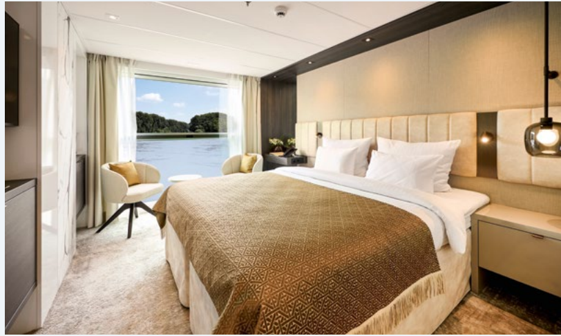
Elegante Kabinen A1 (Mozart Deck) und B1/B4 (Strauss Deck)